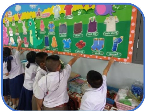
ขอรับรองว่าเป็นความจริง

ผู้เรียนได้รับการพัฒนาคุณภาพด้านวิชาการและงานบริการอื่นๆ จากการที่ครูนำองค์ความรู้ที่ได้รับการพัฒนาตนเองและวิชาชีพมาใช้ในการพัฒนางานวิชาการและงานบริการอื่น ๆ