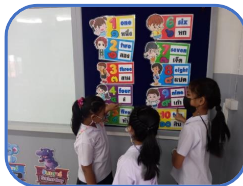
ขอรับรองว่าเป็นความจริง